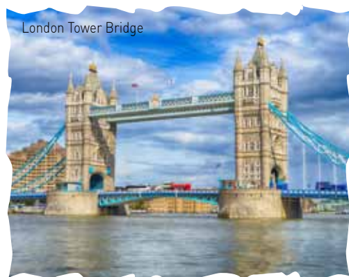
London Tower Bridge

5. Tag: Brest/Frankreich. Bei den heutigen Ausflügen können Sie "Die Küste der Legenden" erkunden. Alternativ empfehlen wir einen Besuch der bretonischen Städtchen Quimper oder Locronan - Sie haben die Wahl.