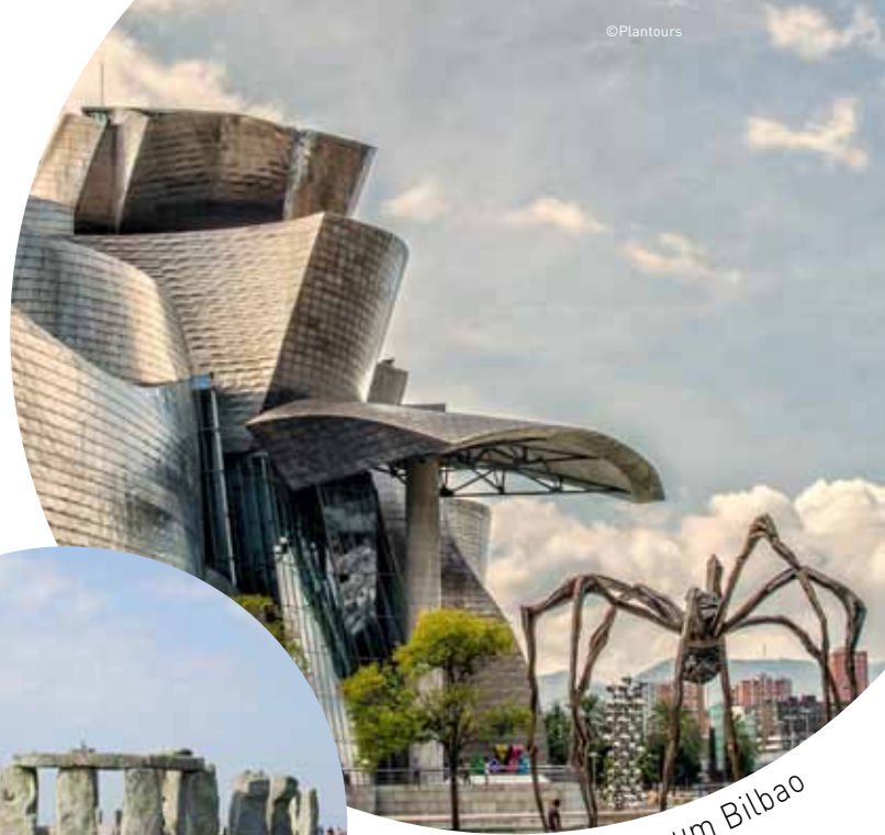
Guggenheim Museum Bilbao

12. Tag: Lissabon/Portugal - Heilbronn. Nach einem gemütlichen Frühstück an Bord Ausschiffung, Rückflug nach Deutschland und Rückreise nach Heilbronn.